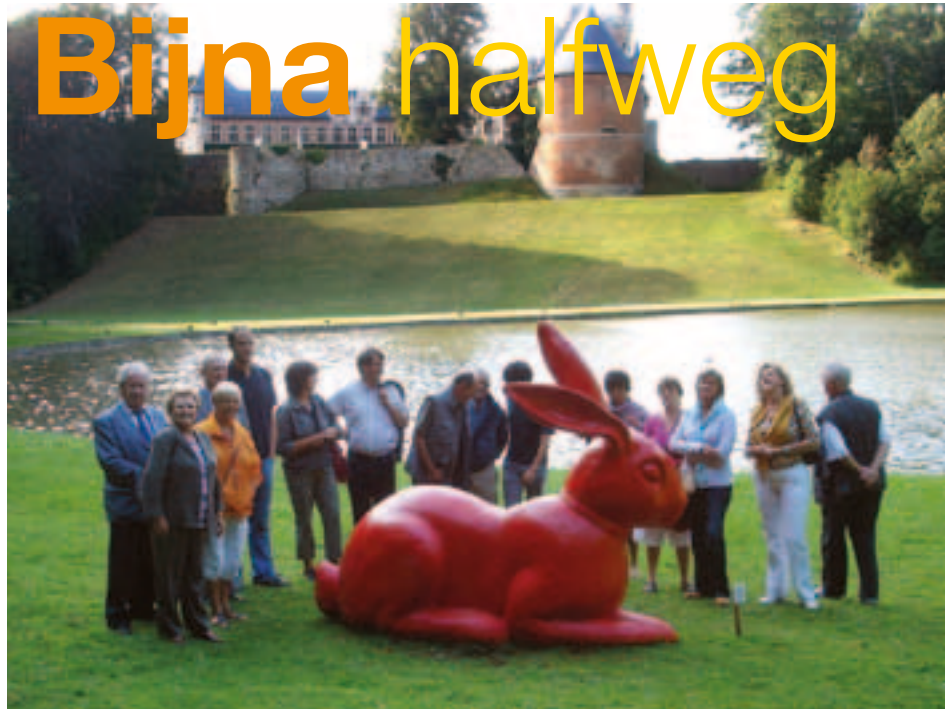
Het CD&V/N-VA/DNA!-kartel ontmoette bij evaluatiebijeenkomst bij Kasteel van Gaasbeek zowaar Rood Konijn