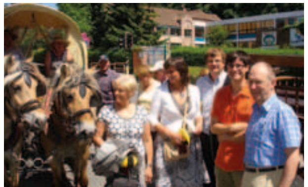
Op de bouwkermis in Savio werden een aantal flinke raspaarden gesignaleerd